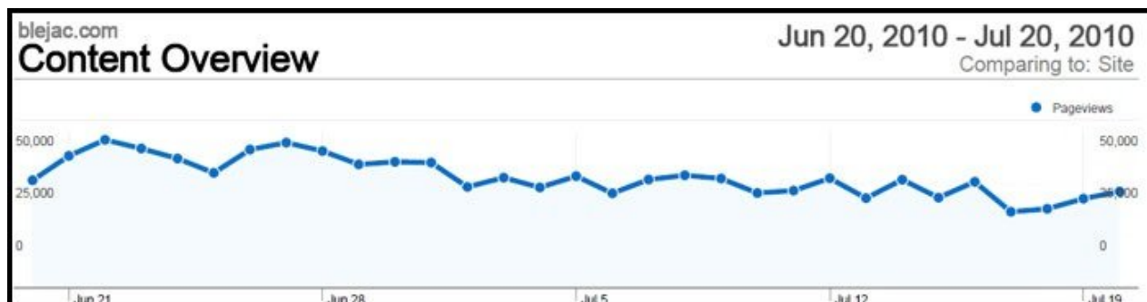
Statistika otvorenih stranica za jun-jul 2010. godine